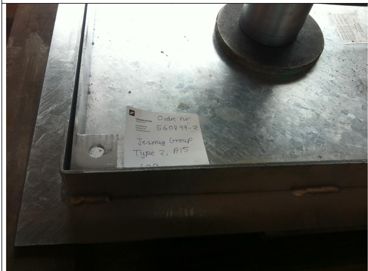
Jesmig Group ApS dæksel, A15, dimension 500x500 mm